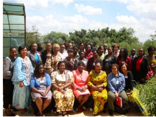
(أعلى: صورة جماعية – إجتتماع تحالف تضامن من أجل حقوق المرأة الإفريقية لإستعراض العمل ووضع الأجندة.)