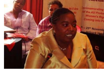
(سعادة السفيرة: جوما تتحدث. ريفيلو ليدوك (سفارة ليسوتو لدى إثيوبيا) تجلس على اليسار.)